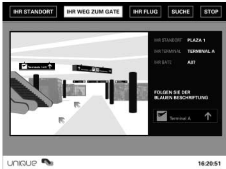
Interfacemaske „IHR WEG ZUM GATE“