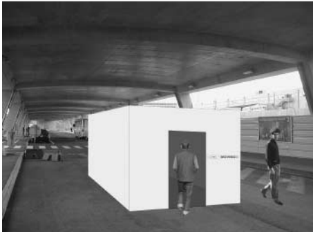
Modellansicht der Box

Um eine realitätsnahe Umgebung zu schaffen, mit dem Anspruch, dass der Besucher/die Besucherin direkt in das neue Leitsystem eingebunden wird, findet die Präsentation der beiden Szenarien in einer 12 m 2 grossen Box statt. Somit kann man das interaktive Leitsystem mit einem touchscreen-gestützten Automaten selber testen und sich durch die Szenarien im Flughafen bewegen.