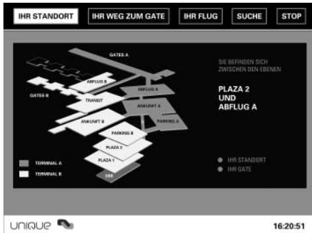
Interfacemaske „IHR STANDORT“