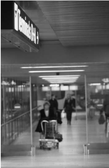
Ausschnitt aus dem zweiten Szenario

Mit einer räumlichen Inszenierung in einer 12 m 2 grossen Box wird eine reale Situation aus dem Flughafenterminal geschaffen, in welcher der Besucher/die Besucherin direkt in das neue Leitsystem eingebunden wird. Der Benutzer kann das optimierte Fussgängerleitsystem virtuell durchschreiten und den ersten Prototypen persönlich testen.