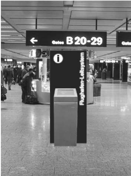
Frontansicht des neuen Leitsystems

Durch Berühren des Touchscreens und Auswahl der Sprache erfolgt die Identifikation mittels FlughafenID-Karte. Nach dem erfolgreichen Laden der Daten hat der Benutzer Zugriff auf die fünf Navigationstasten im oberen Bereich des Bildschirms. Das Design ist so angelegt, dass sich die Hauptinformationen im mittleren Teil befinden. Am unteren Bildrand befinden sich die aktuelle Uhrzeit sowie die Werbefläche, welche jeder Flughafen spezifisch nutzen kann.