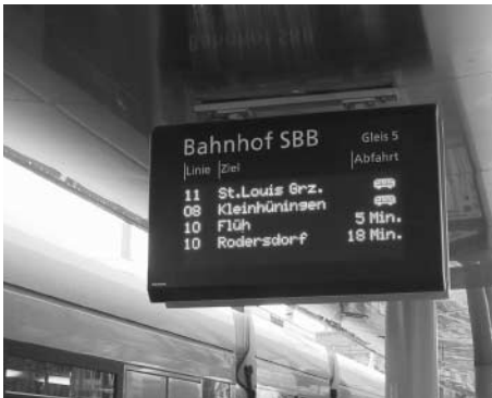
Dynamische Fahrgastinformation im ÖV

Bei den Informationssystemen im öffentlichen Verkehr setzt SmartInfo von Siemens Verkehrstechnik neue Massstäbe. SmartInfo ist die erste dynamische Fahrgastinformation an Haltestellen, welche den Reisenden die aktuellen Informationen über Bus- oder Tramlinien in Realtime anzeigt. Der Hauptvorteil liegt darin, dem Fahrgast auf einen Blick anzuzeigen, wann welches Verkehrsmittel wirklich an der Haltestelle eintreffen wird. Dynamische Systeme können nicht nur die Uhrzeit des Eintreffens anzeigen, sondern – was entscheidend ist – auch die verbleibende Wartezeit. Dadurch steigt die Verlässlichkeit der Information. Vor allem aber verkürzt sich der subjektiv empfundene Aufenthalt an der Haltestelle.