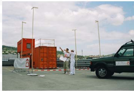
JW-Stadtbesetzung Parkdeck Toni Molkerei