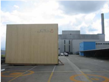
Das City-Modul mit der Toni Fabrik im Hintergrund

City-Module stehen für mehr Wohnraum und für grössere Mobilität. Es sind mobile Wohnmodule, die sich in der Stadt wie Sitzbänke oder Telefonkabinen durch eine einfache Funktion mit einheitlichem Design auszeichnen. Sie können mit wenig Aufwand transportiert und für verschiedene Nutzungen wie Wohnen und Arbeiten eingesetzt werden. Durch den "Lego-artigen" Aufbau sind sie in allen erdenklichen Grundrissen und Grössen realisierbar. Diese Flexibilität soll nicht nur die temporäre Nutzung von städtischen Zwischenräumen und Baubrachen ermöglichen, sondern die Möglichkeit bieten, schnell Raum in der Stadt zu mieten. Das City-Modul hinterlässt keine Spuren, wenn es von einem Standort an einen anderen verschoben wird.