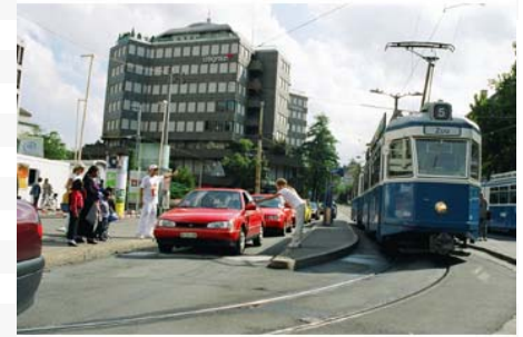
JW-Stadtbesetzung Bahnhof Enge