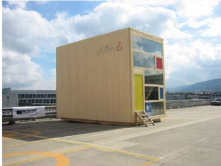
Das fertig installierte Eigenheim an traumhafter Lage hoch über den Dächern von Zürich