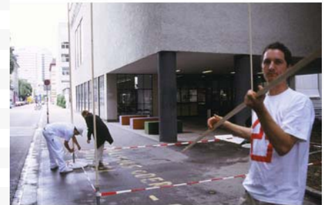
JW-Stadtbesetzung HGKZ Ausstellung "Wohnen"